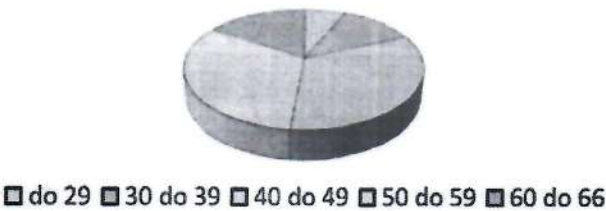
Dobna struktura grafikona 2024. godine

Na dan 31.prosinac 2024. godine bilo je zaposleno ukupno 167 radnika, za 10 više nego na dan 31.prosinac 2023. Ukupno je tijekom godine otišlo 17 radnika iz tvrtke, a 27 ih se zaposlilo u Čistoću d.o.o. Karlovac.